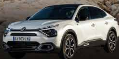
Citroen C4 X